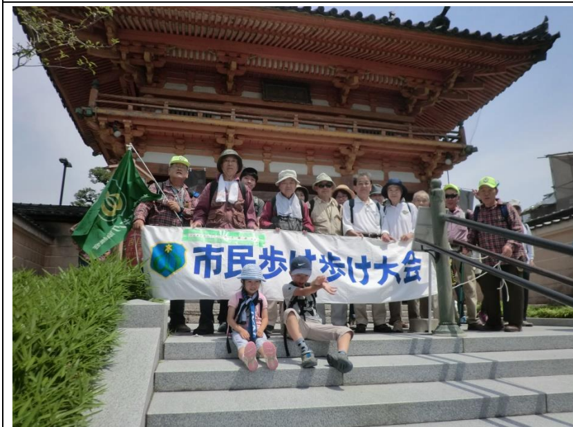
集合写真総持寺門前 10:33