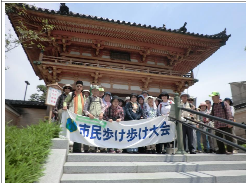
集合写真総持寺門前 10:32