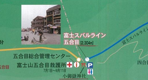
⑦五合目 木山と焼山の境界である天地境と呼ばれる地点。標高2,300mの森林限界のこの辺りでは、一気に展望も開け、眼下の眺望を楽しむことができます。

富士山登山認定書 吉田口登山道開山期間中、ふもとから山頂まで登山していただいた皆様に富士山登山認定書を発行します。 受付期間：令和元年9月30日まで