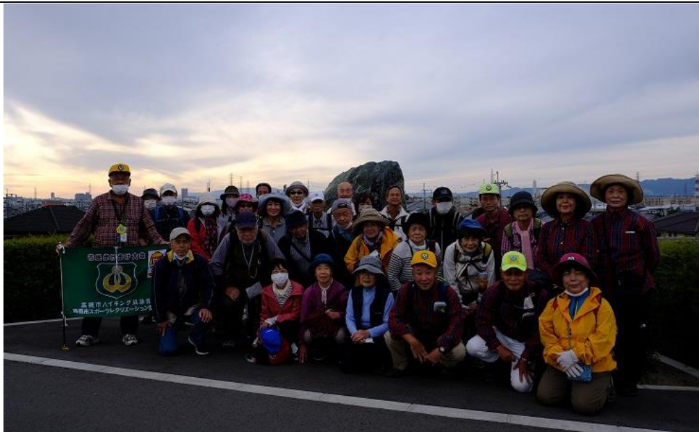
くらわんか舟発祥地の碑前集合写真 15:39