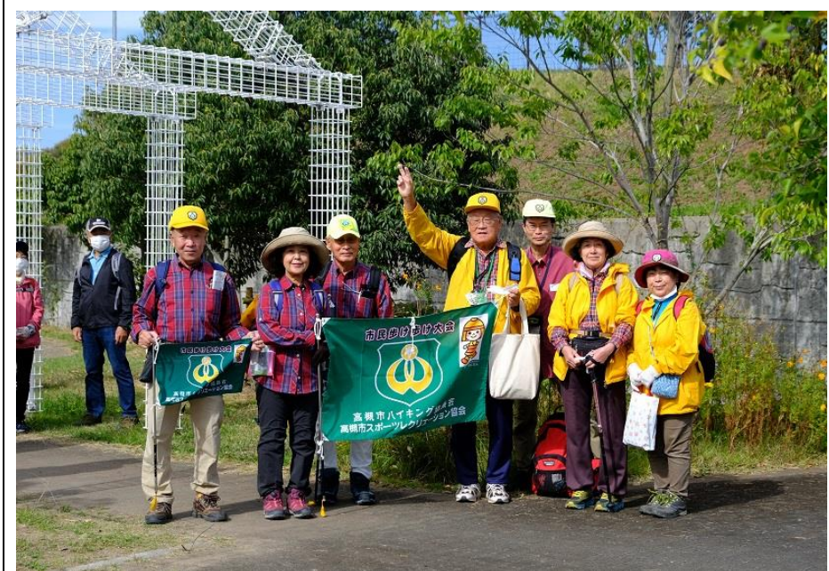
清水池公園集合写真 13:04