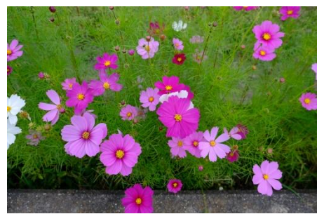
郡家新町のコスモス