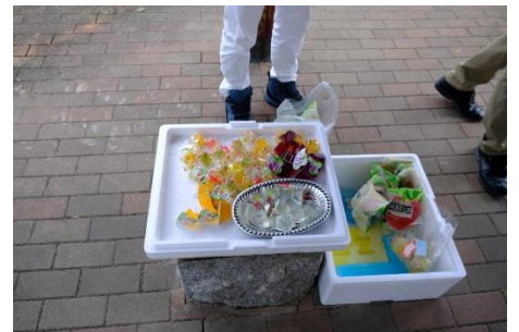
清水池公園・ゼリー配付