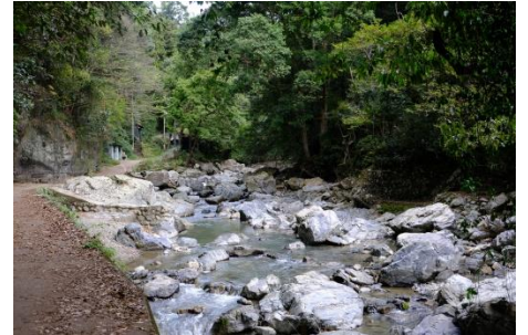
摂津峡・東側.三好山