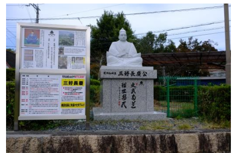
摂津峡桜広場・三好長慶像