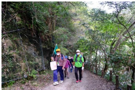
摂津峡・東側三好山