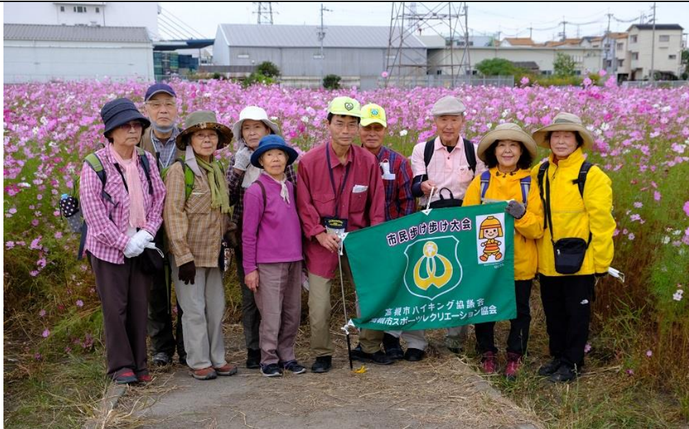
三島江コスモスロード集合写真 15:12