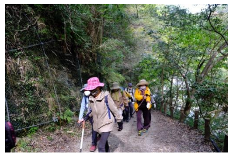
摂津峡・東側三好山