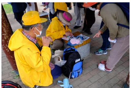
清水池公園・参加スタンプ押印