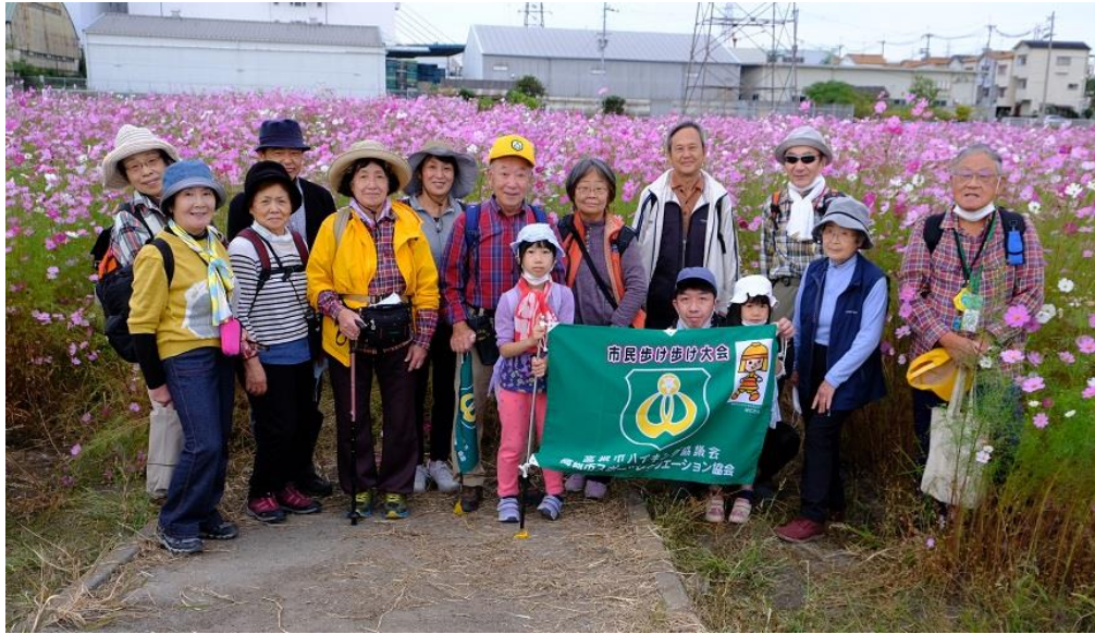
三島江コスモスロード集合写真 15:10