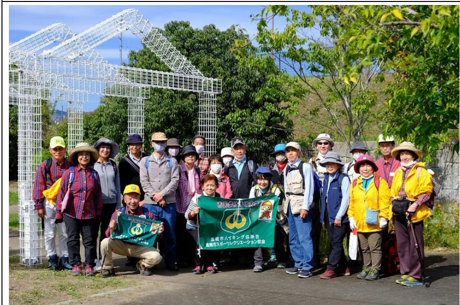
清水池公園集合写真 13:03