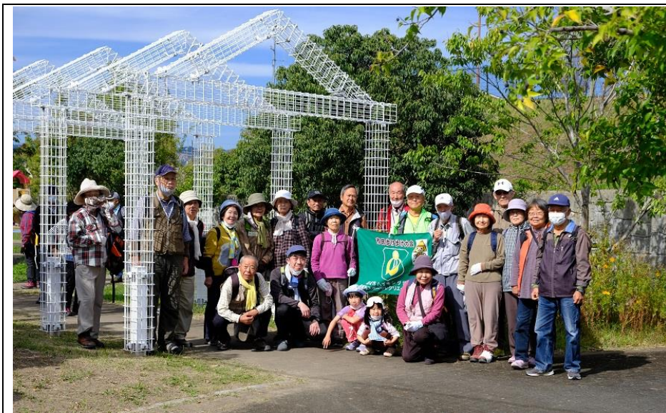
清水池公園集合写真 13:02