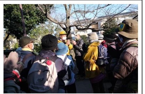
元茨木川緑地中間地点会長挨拶