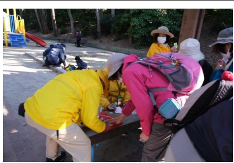
西河原公園(参加記念スタンプ)