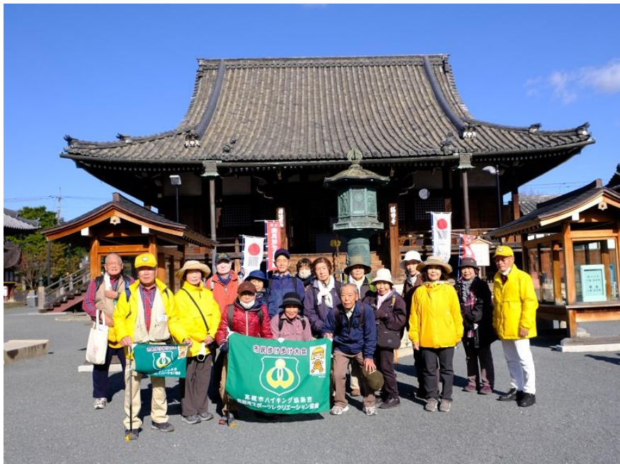
総持寺本堂前集合写真 10:57