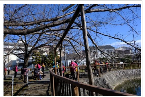
富田公民館筒井池