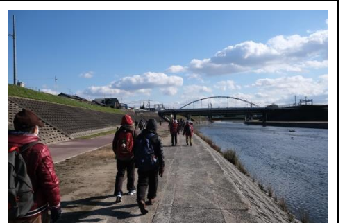
安威川河川敷東側