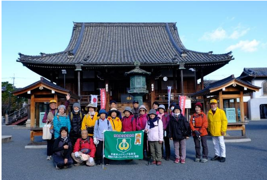
総持寺本堂前集合写真 10:55