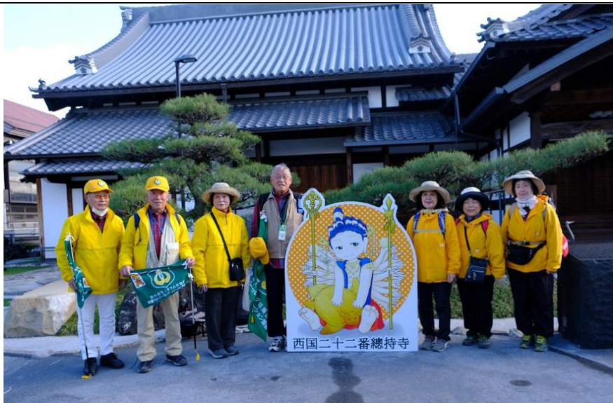
総持寺母屋役員集合写真 11:00