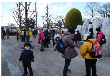
桑田公園この子誰の子