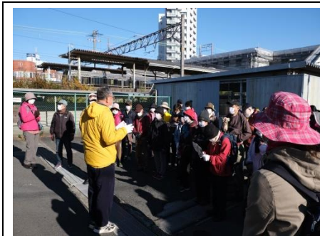
JR 摂津富田駅南口広場