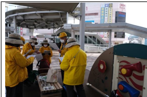
JR 高槻駅南側人工デッキ