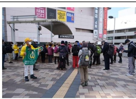
JR 高槻駅南側人工デッキ