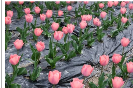
西ノ川北公園のチューリップ