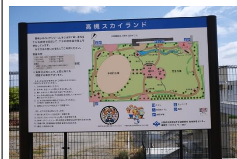
スカイランド案内図