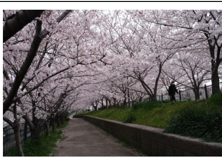
シーズン中の玉川の里桜並木