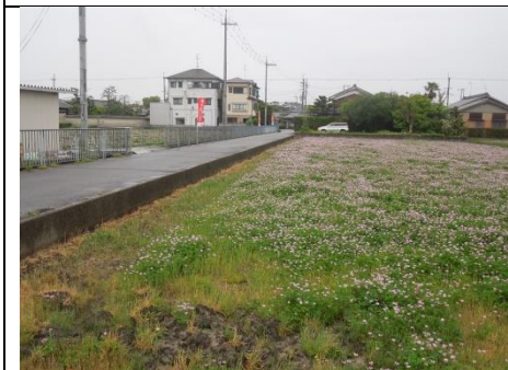
三島江レンゲの里