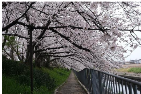
玉川の里とから西ノ川北公園へ