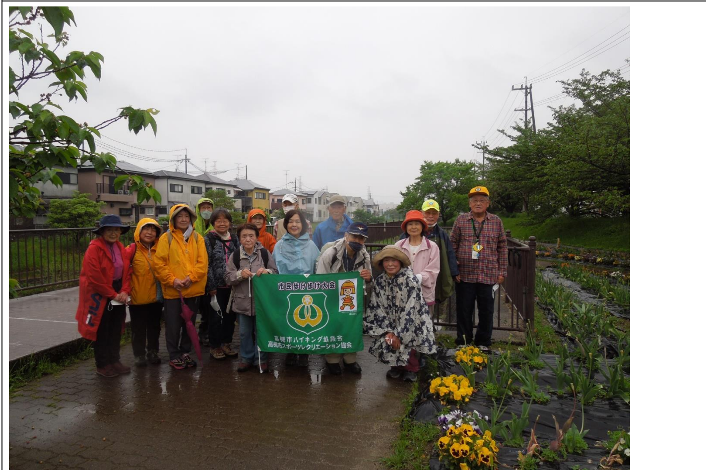
西ノ川北広場集合写真 11:46