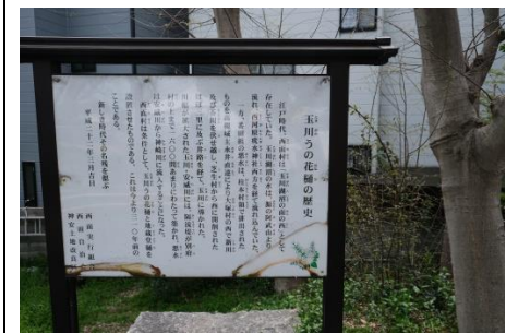
玉川うの花樋の説明書