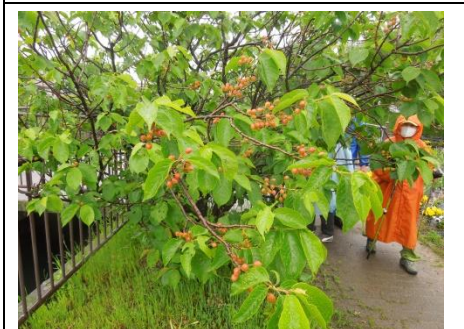
コース途中のさくらんぼの実