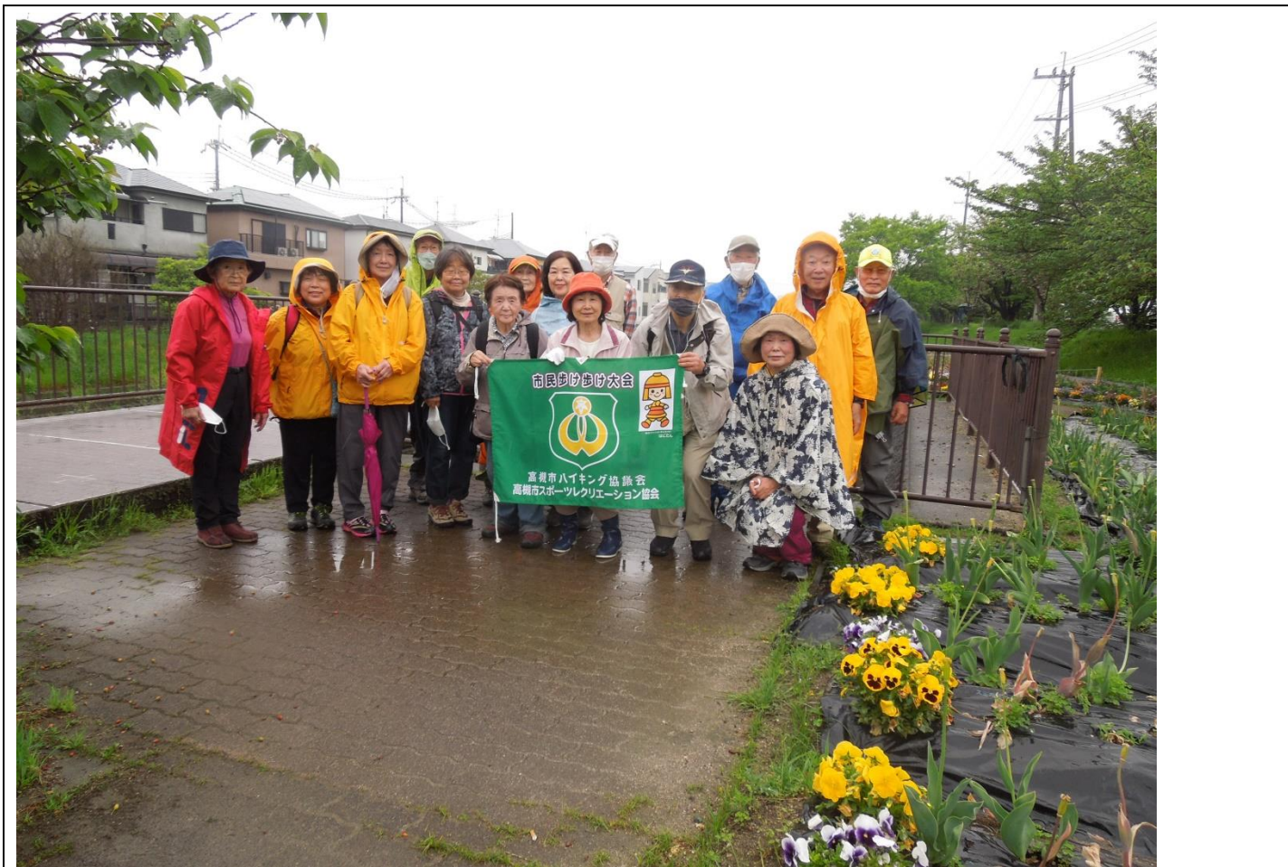
西ノ川北広場集合写真 11:45