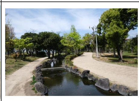
南大樋せせらぎ緑地