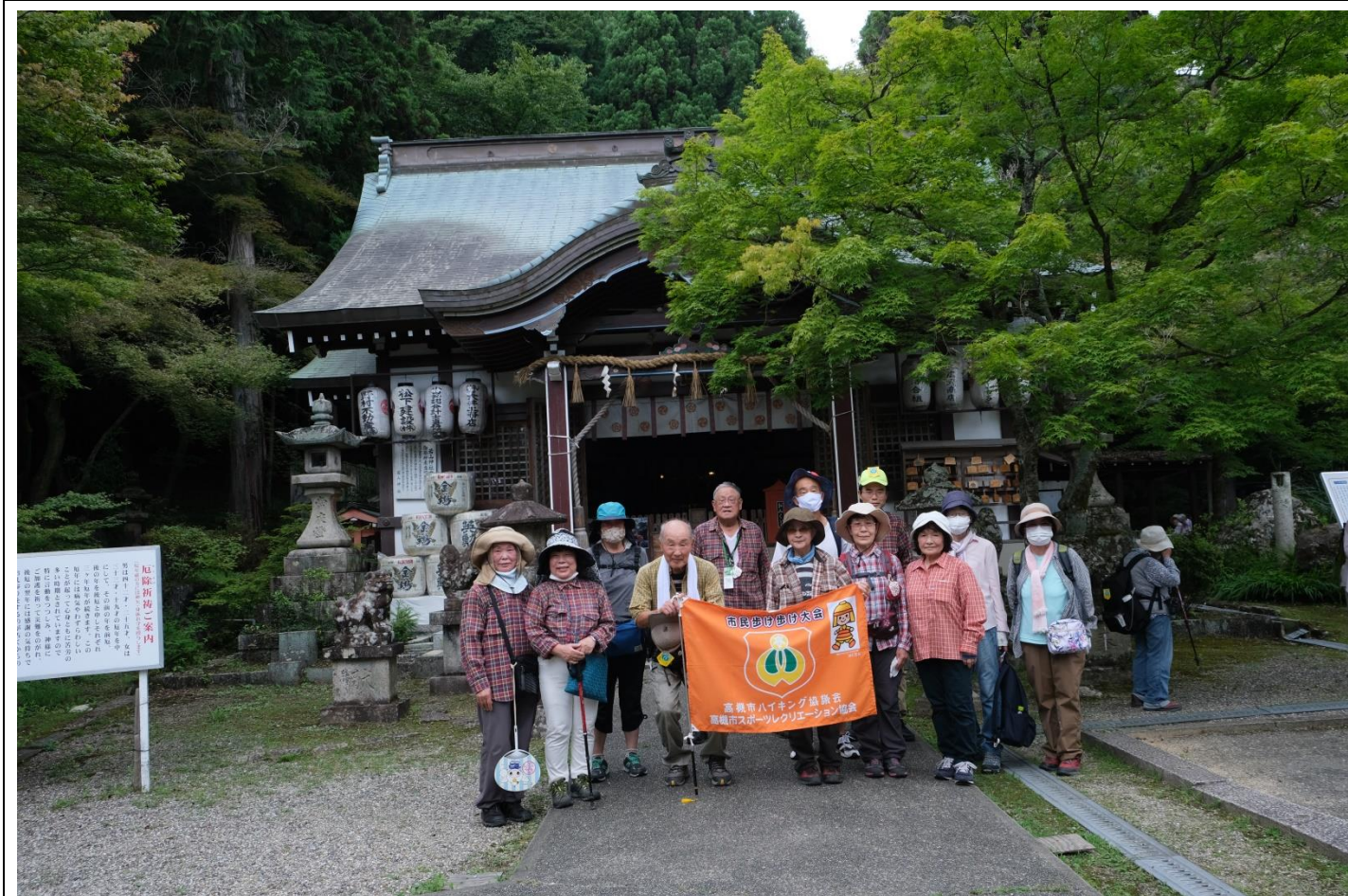
若山神社集合写真 10:30