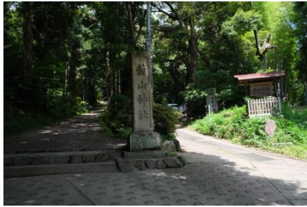
若山神社(登りの始まり)