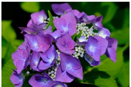
柳谷観音の紫陽花