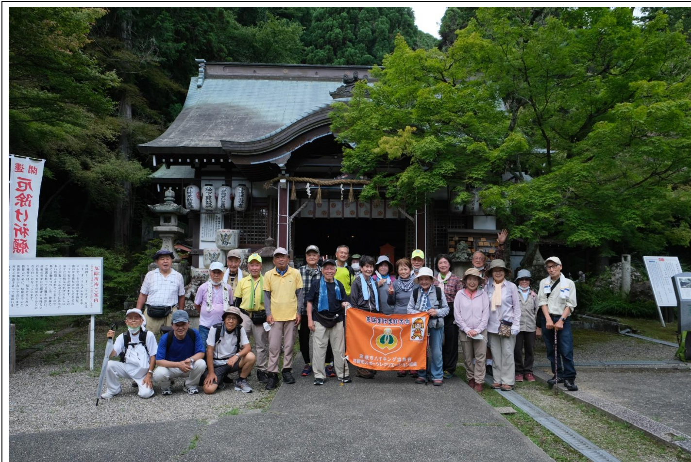
若山神社集合写真 10:29