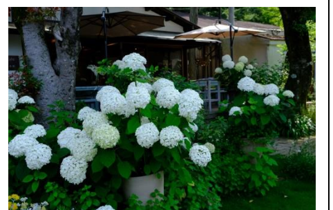
長岡天満宮内茶店の紫陽花