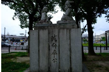
桜井駅跡楠木正成親子別れの像