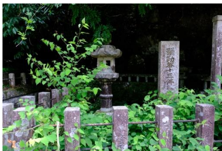
彌勒十三仏所在地