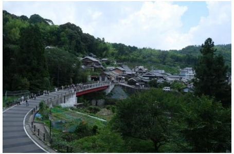
尺代地区ながとり大橋を望む