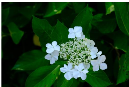
長岡天満宮の紫陽花