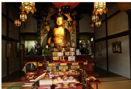
浄土谷乗願寺「おおぼとけ」