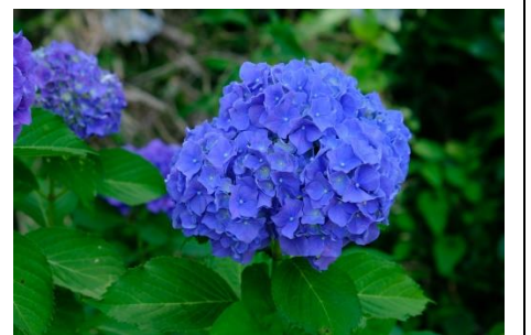
長岡公園の紫陽花