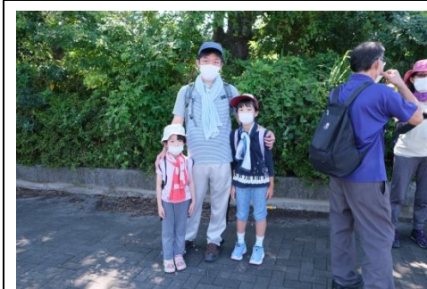
常連さん姉妹とパパ