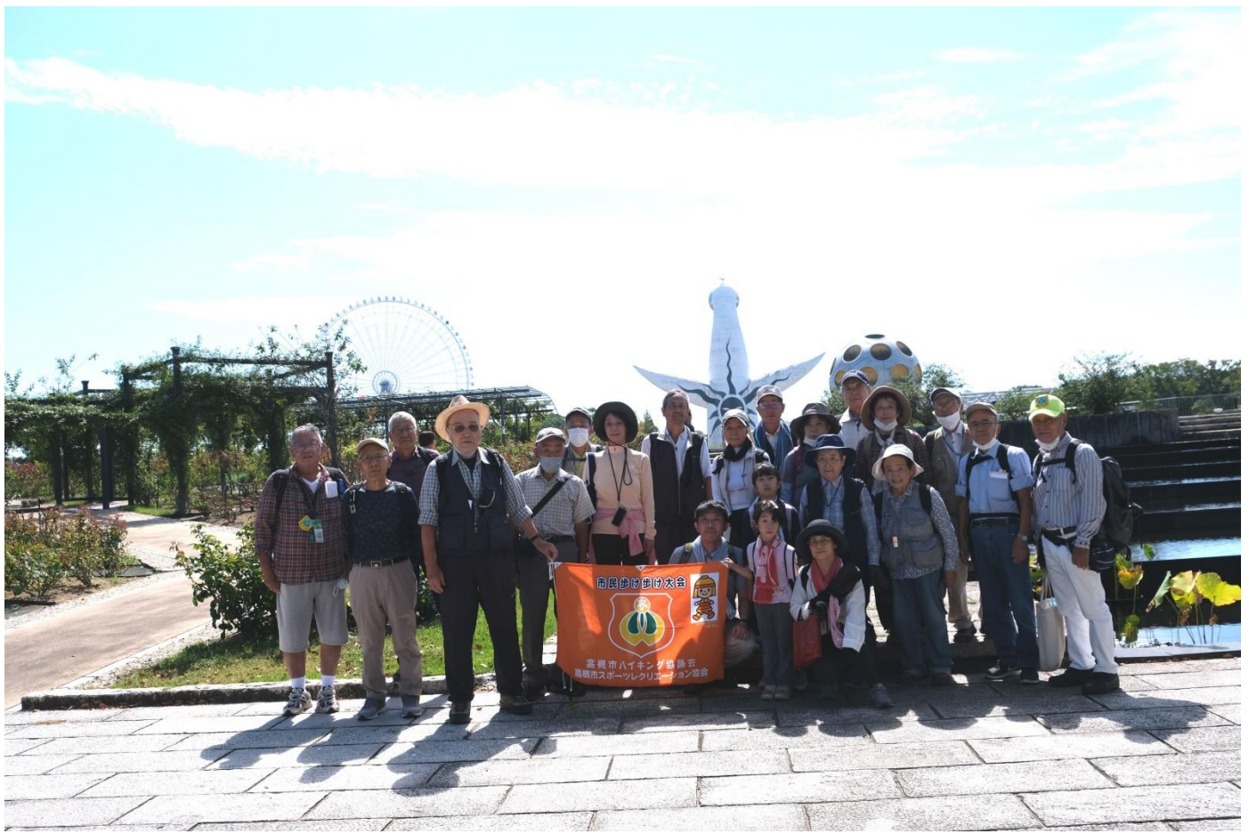
万博日本庭園正門前集合写真 11:40