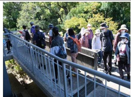
日本庭園中央休憩所へ