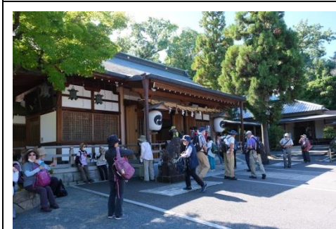
山田伊射奈岐神社