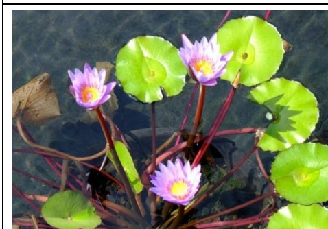
日本庭園数少ない花