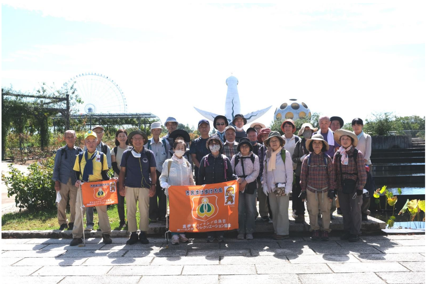
万博日本庭園正門前集合写真 11:40