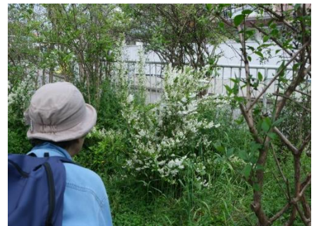
高槻市民の花「うのはな」