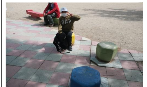
高槻城公園(小学生参加者)