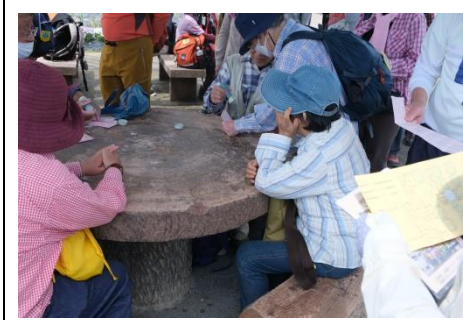
西ノ川北広場参加スタンプ押印