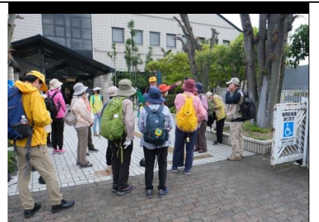
小寺池図書館前解散挨拶