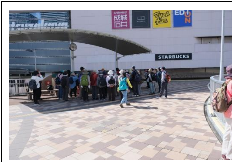
JR 高槻駅南側人工デッキ