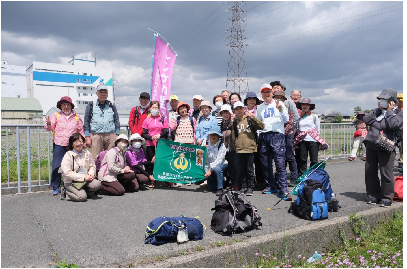
三島江レンゲの里集合写真 12:45