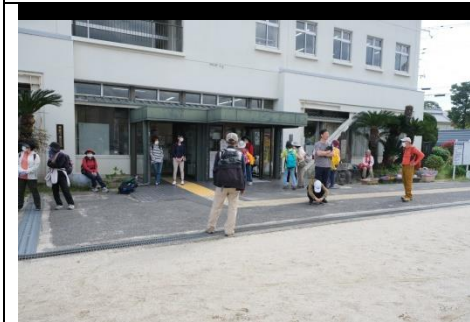
富田公民館前(あと少し頑張ろう！)