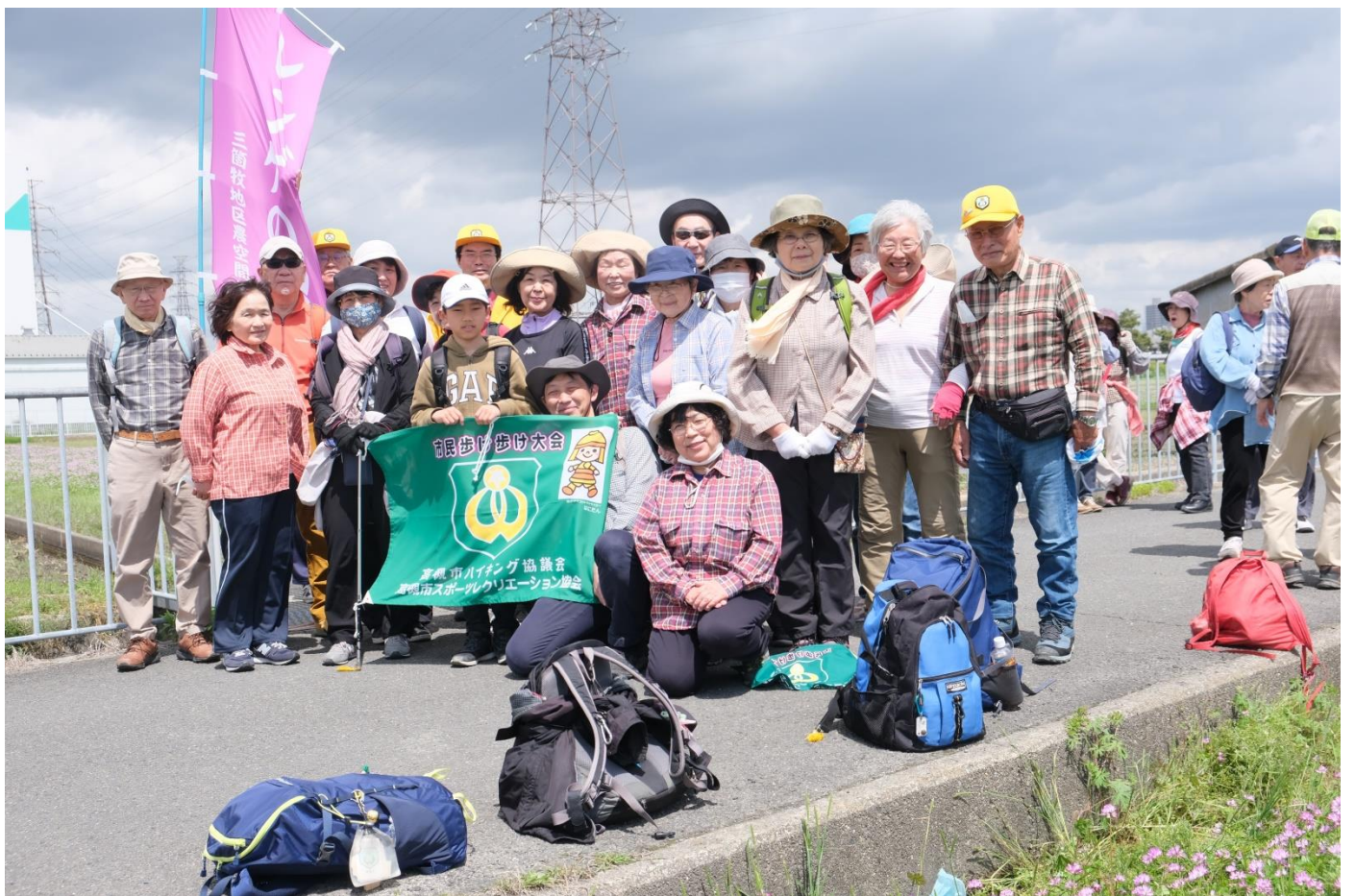
三島江レンゲの里集合写真 12:45