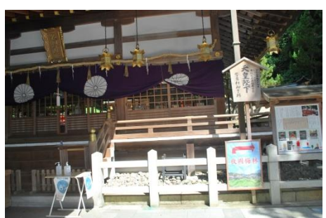
枚岡神社本殿(神様に休み無)