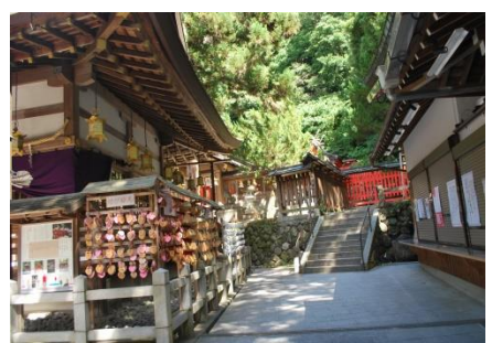
枚岡神社本殿(願いは実現?)