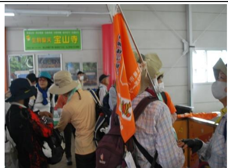
近鉄生駒ケーブル鳥居前駅