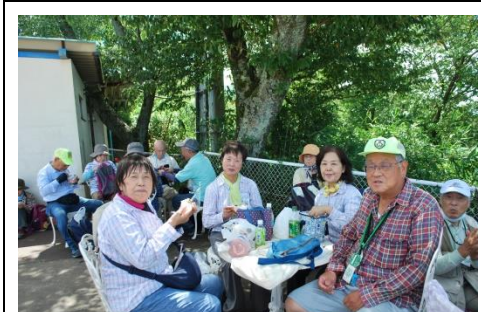
生駒山頂公園(本番は昼食後)