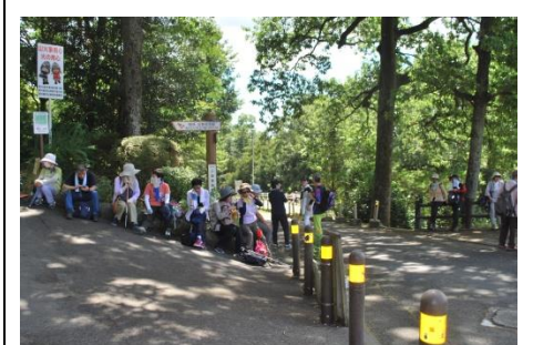
枚岡公園管理事務所前