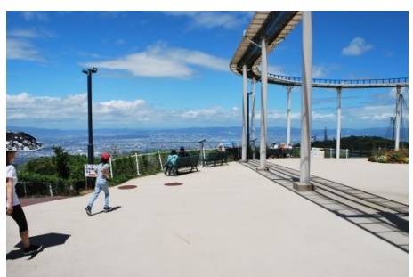
生駒山頂公園(乗り物沢山有り)