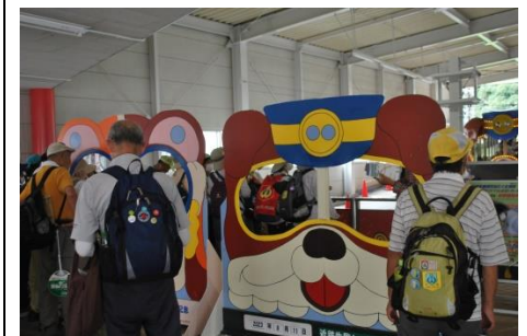
近鉄生駒ケーブル鳥居前駅