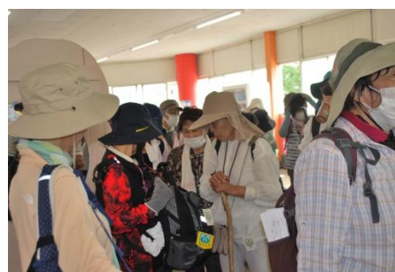
近鉄生駒ケーブル車中