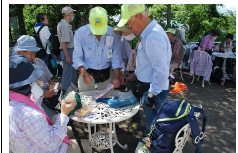
生駒山頂公園記念スタンプ押印