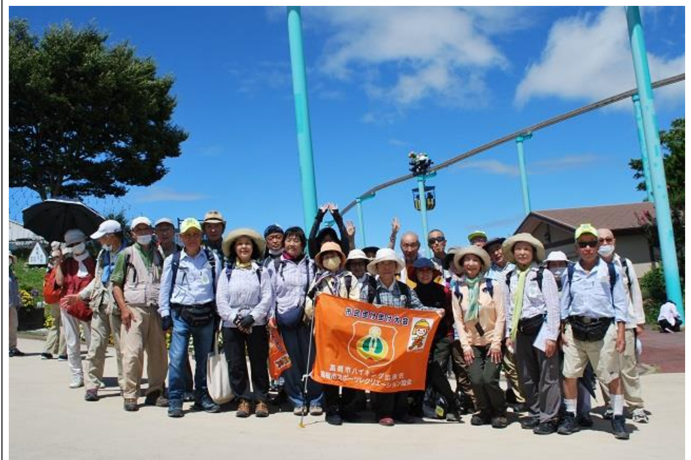
生駒山山頂集合写真 11:00