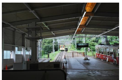
近鉄生駒ケーブル鳥居前駅