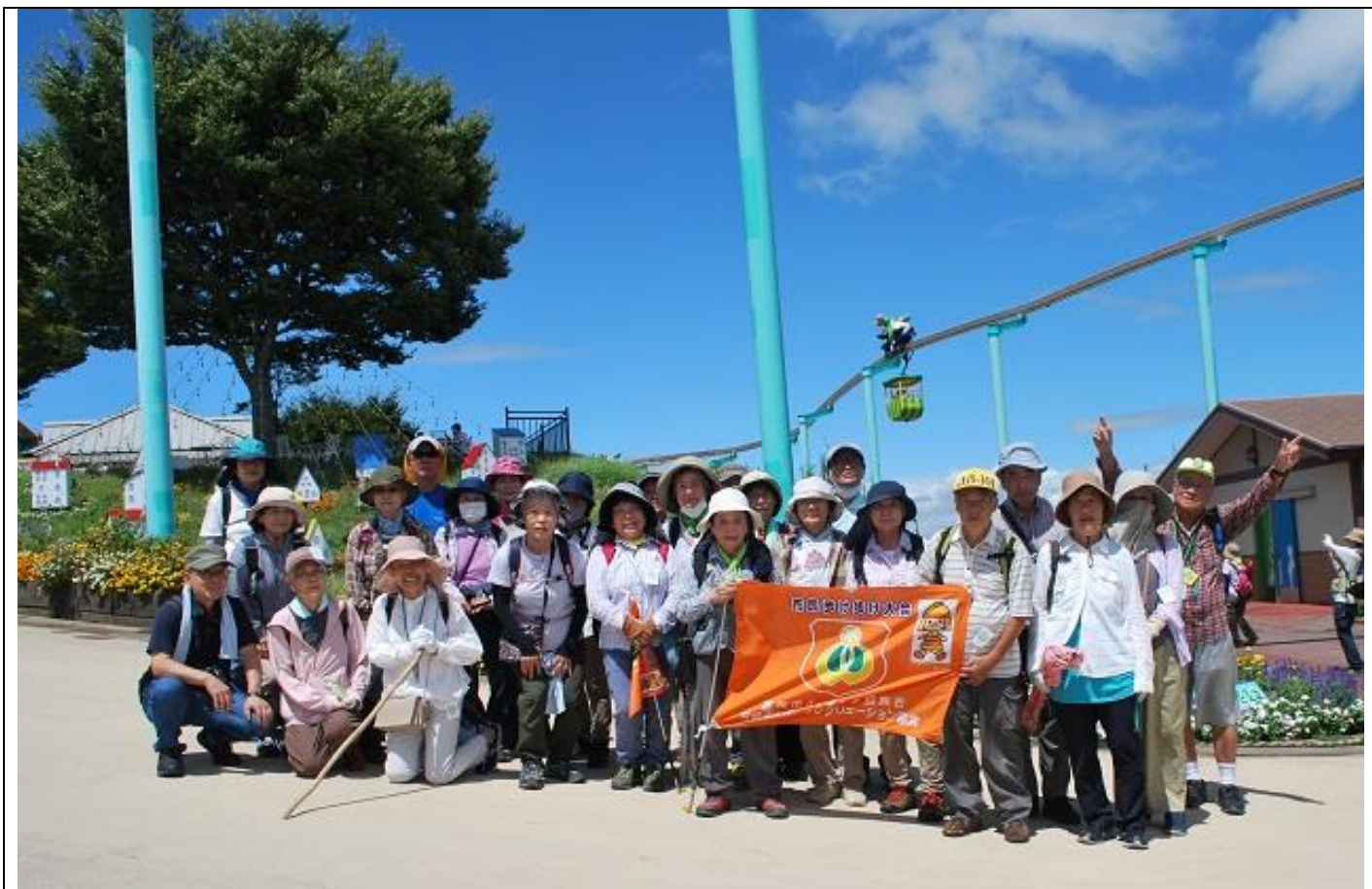
生駒山山頂集合写真 11:00