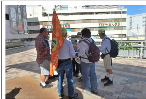
JR 高槻駅南側人工デッキ