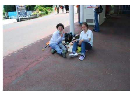
生駒山頂公園(アルコール無)