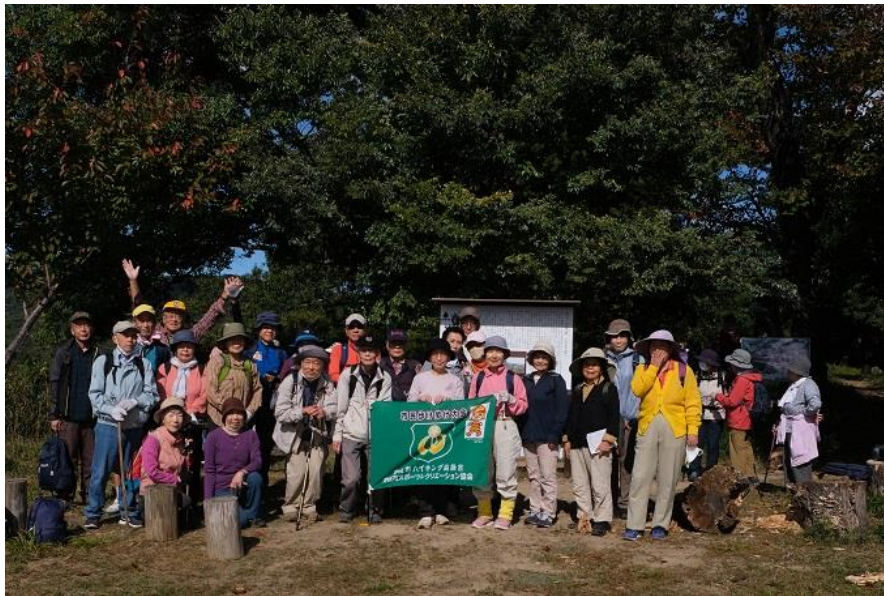
三好山山頂集合写真 10:27