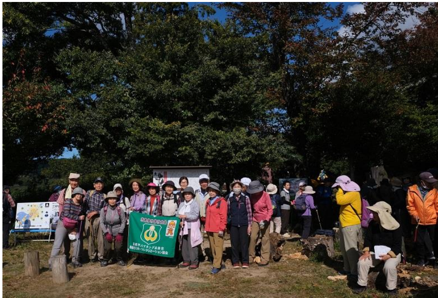
三好山山頂集合写真 10:28