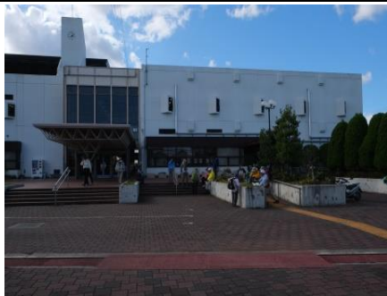
総合スポーツセンター前