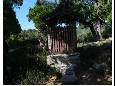
三好長慶由来の祠