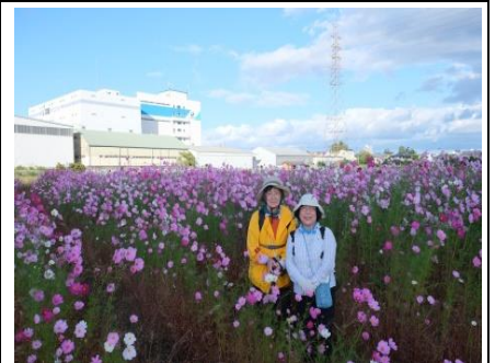
相変わらず花婿募集中です