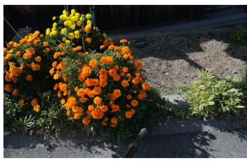
コスモスと張り合える花か?