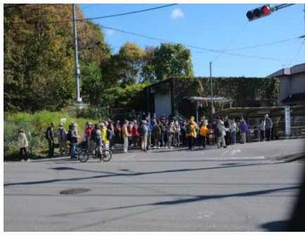
市バス上のロバス停