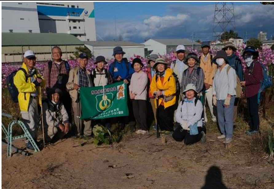
コスモスロード集合写真 15:24