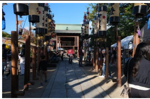
三島鴨神社秋祭り