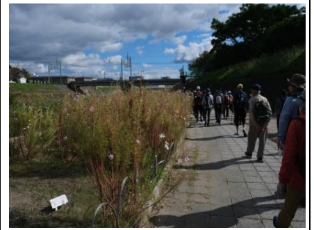
芥川河川敷急がないと遅れてる