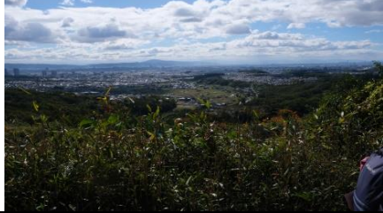
三好山山頂よりの眺望