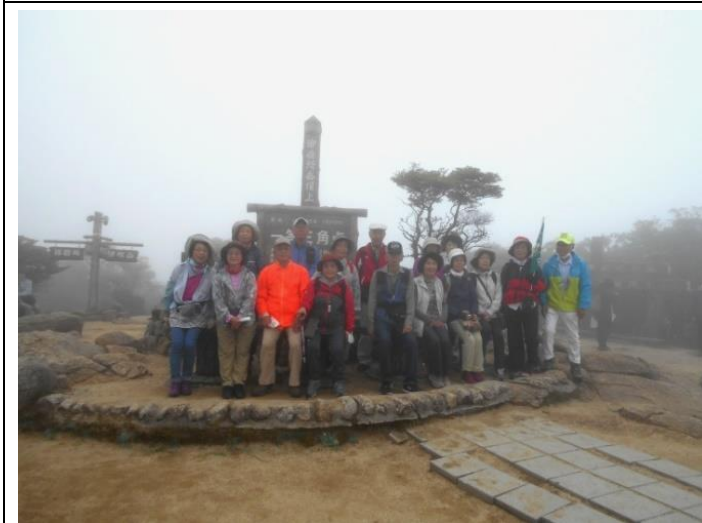
御在所岳山頂集合写真 B 班 10 : 45 頃