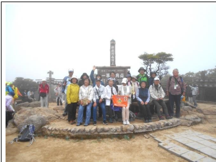
御在所岳山頂集合写真 A 班 10 : 45 頃