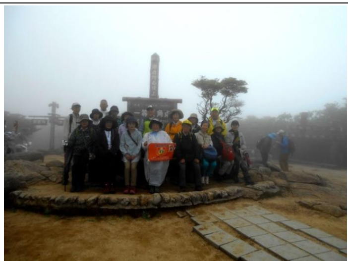
御在所岳山頂集合写真 C 班 10 : 45 頃