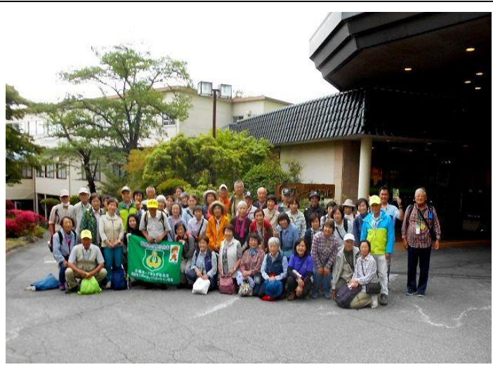
湯元グリーンホテル前 15 : 00