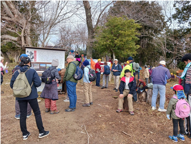
三好山(芥川山城跡)①