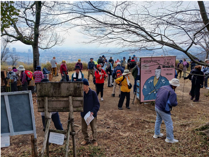
三好山(芥川山城跡)②