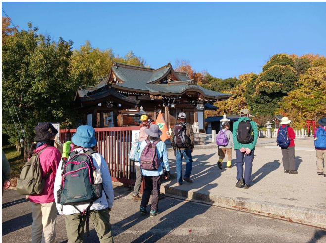
つげの 関鶏野神社