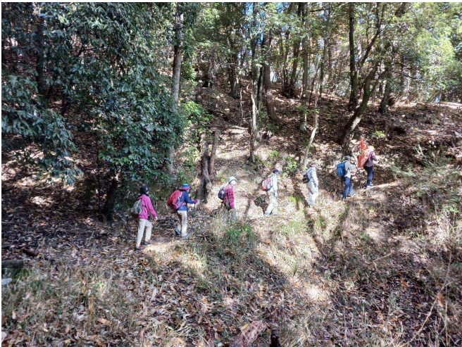
展望台へ向かう途中①