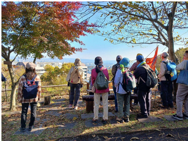
観測所見晴らし台