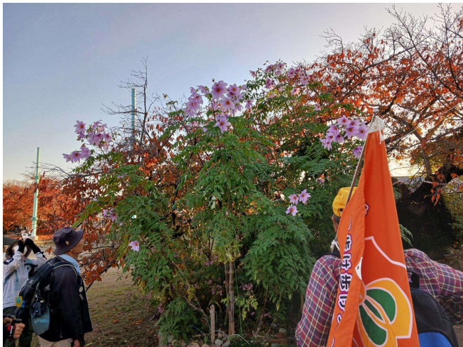
芥川桜堤公園(皇帝ダリア)