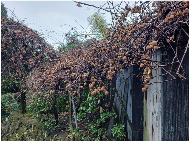
キウイが沢山実っていた