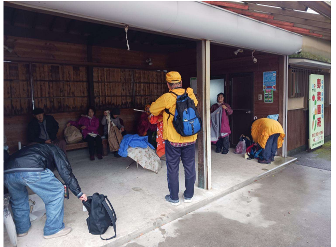
萩谷総合公園(昼食)