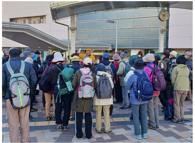
JR高槻駅南側人工デッキ(集合)②