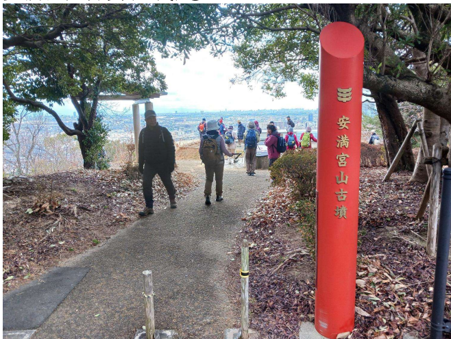
安満宮山古墳(昼食)①