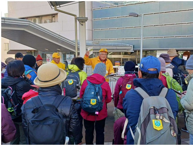
JR高槻駅南側人工デッキ(集合)①